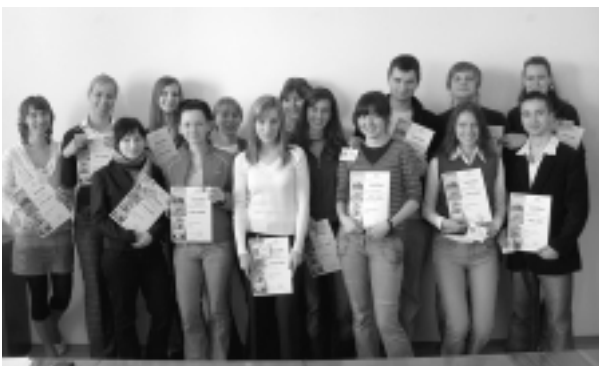
Na snímke účastníci kurzu s certifikátmi o úspešnom absolvovaní kurzu.