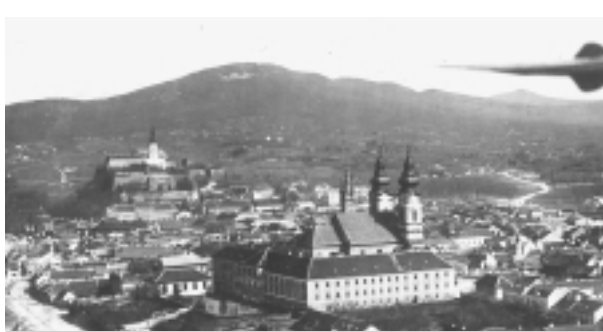
Vďaka rozmachu leteckej dopravy sa nám zachovali aj takéto fotografie starej Nitry. Hore v pravom rohu môžete registrovať časť z lietadla.

Záujem nitrianskej verejnosti o lietanie bol veľký, čoho dôkazom bola vždy veľká účasť na leteckých dňoch, organizovaných nitrianskou leteckou posádkou. Záujem o tento druh dopravy zosilnel a nastal rozmach leteckej dopravy a leteckej pošty v Európe. Národohospodári, ekonómovia, finančníci, dopravcovia, ale hlavne vojenský odborníci starostlivo sledovali vývoj v letectve. V ČSR to vyústilo do založenia celoštátnej Masarykovej leteckej ligy, čo schválilo ministerstvo vnútra výnosom zo dňa 22. februára 1926 pod č. 10331/1926/6. Popularita ligy stúpala aj vďaka samotnému prezidentovi republiky Dr. Tomášovi Masarykovi, ktorý sa stal jej protektorom.