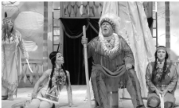
Poslednou rozprávkou, ktorú pripravilo DAB, bol Peter Pan.