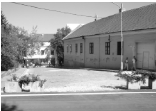
Z miestnej komunikácie spájajúcej Vršok s Farskou ulicou sa stala pešia zóna.

pokladať, že pochádza približne z roku 1776. Na miestnej komunikácii, spájajúcej Vršok s Farskou ulicou, ste si už mohli všimnúť nedávno osadené dopravné značky, upozorňujúce na zmeny v doprave. Miestna komunikácia Na Vršku v rámci zmien týkajúcich sa uzavretia Mariánskej ulice sa zmenila na jednosmernú cestu, ale v opačnom smere ako to bolo doteraz, t.j. od Farskej ulice k Ulici J. Vuruma. Autá, smerujúce z Párovskej ulice na Vršok budú môcť odbočiť len vpravo na Piaristickú ulicu. Pri jazde z Piaristickej ulice môžete ísť len smerom na Párovce. V budúcnosti by sa podľa prednostu malo zrušiť aj parkovanie na jednosmernej Školskej ulici, pre autá by však táto cesta mala zostať prejazdná. (syn)